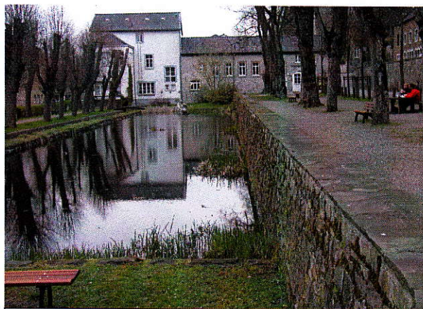
Sollzustand nach Reinigung

als Eigentümerin des Parks –, haben wir Fachfirmen kontaktiert und uns beraten lassen. Die Auskunft war, dass entweder mit Hilfe von chemischen Mitteln oder durch Wasserbewegung Abhilfe zu schaffen sei. Deshalb haben wir die Bezirksvertretung B4 um Mittel gebeten, damit im Becken Strömungspumpen eingesetzt werden können. Der Zuschuss wurde genehmigt, die Pumpen beschafft und Ende Mai installiert.