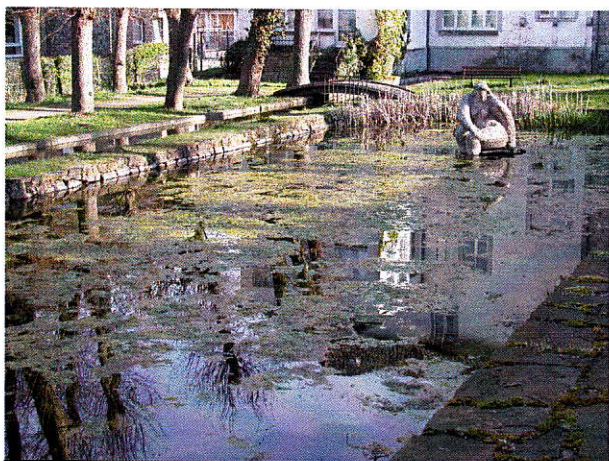
Becken durch Algen „verschönert“

Seit Jahren verfolgt uns die Plage des Algenwachstums im Becken des Abteigartens. Da uns leider aus der Stadtverwaltung jede Unterstützung fehlte, wie mit diesem Problem umzugehen sei – der sachgerechte Unterhalt und die Problemlösung wären ihre Aufgabe